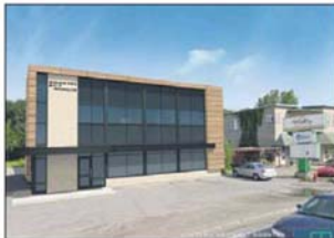
Un point de vente sera aménagé dans la nouvelle construction.

«La raison de cette nouvelle construction est que la maison mère n'a plus l'espace nécessaire pour abriter tous nos employés, surtout de par l'acquisition récente de compagnies de téléphone indépendantes, tel que